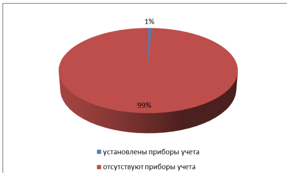
Рисунок 3.3. Оценка оснащенности приборами учета в Плотбищенском сельском поселении

За 2012 год доля потребителей воды с установленными приборами учета составляла 1% (рисунок 3.3).